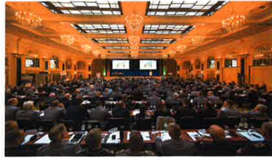
Die Vorstellung der Strategie der Reserve im Herbst 2019