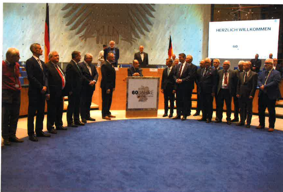
Die Verpflichtung des 20. Präsidiums des Reservistenverbandes im alten Plenarsaal in Bonn

Auf der 20. Bundesdelegiertenversammlung im November 2019 in Bonn wurde ein neues Präsidium verpflichtet. Im Folgenden werden die Präsidenten und Vizepräsidenten kurz vorgestellt.