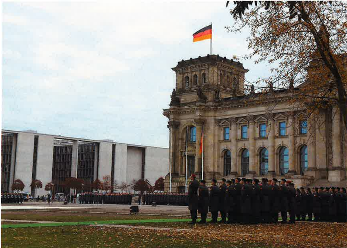
Gelöbnis von Rekrutinnen und Rekruten anlässlich des Geburtstages der Bundeswehr vor dem Reichstagsgebäude in Berlin