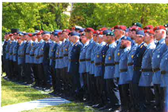
Der Indienststellungsappell des Landesregiments Bayern in Roth.