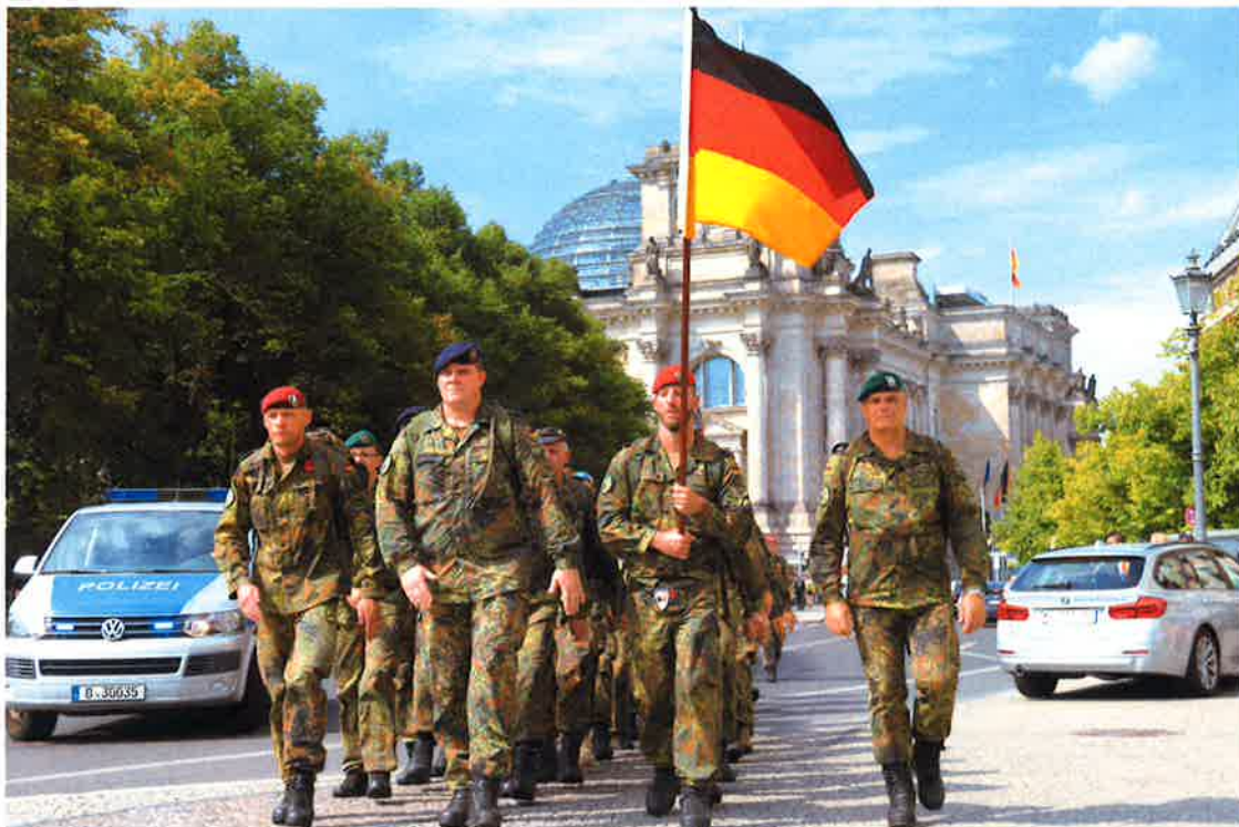
Der Marsch zum Gedenken 2019 in Berlin.