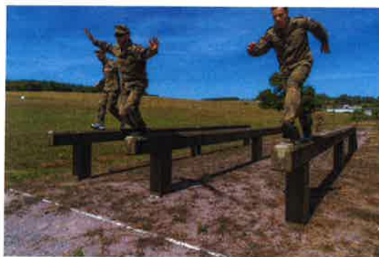
CIOR-Wettkampf in Estland/Talinn