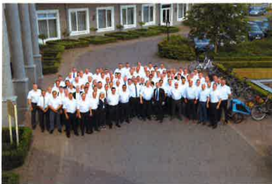
Die Organisationsleiter-Tagung in Linstow