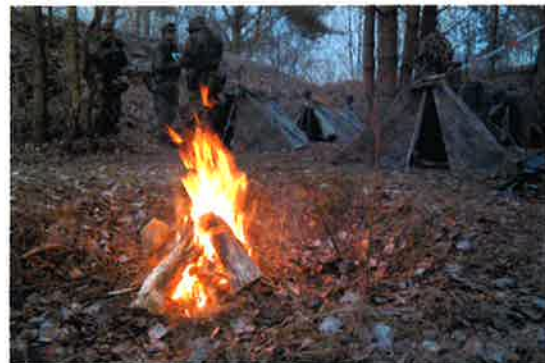
Der Platz der Gruppe bei der Ausbildung Ungedienter der Landesgruppe Berlin