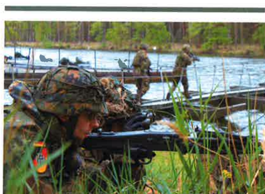
Reservisten während des Motivationstags der Landesgruppe Brandenburg