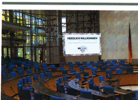
Die 20. Bundesdelegiertenversammlung im November 2019 in Bonn.