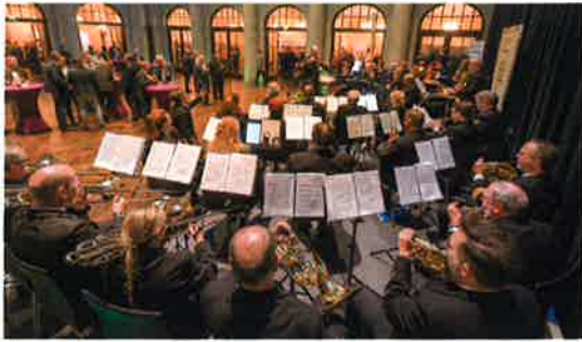
Der Parlamentarische Abend 2019 in Berlin